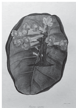
23 大岩桐草の仲間 ( GENIERA RUPESTRIS )

ジョセフ・パクストン(1803-1865)...イギリスの造園家。多数の温室設計の経験をもとに、1851年ロンドンの第一回万国博覧会の水晶宮*の設計に携わった人物。以下は、彼の植物学の著書からの、銅版または石版の鮮やかな手彩色の美しい図譜です。