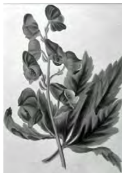
25 からとりかぶと ( ACONITUM CHINENSE )