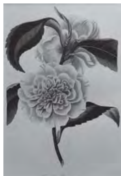
26 八重の椿 ( CAMELLIA PRESSII ROSEA )