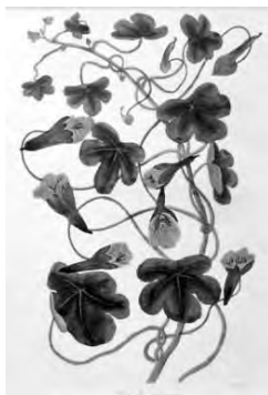
24 金蓮花の仲間 ( TROPAEOLUM TUBEROSUM )