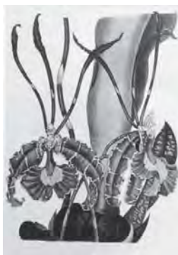
27 蘭 ( ONCIDIUM PAPILIO )